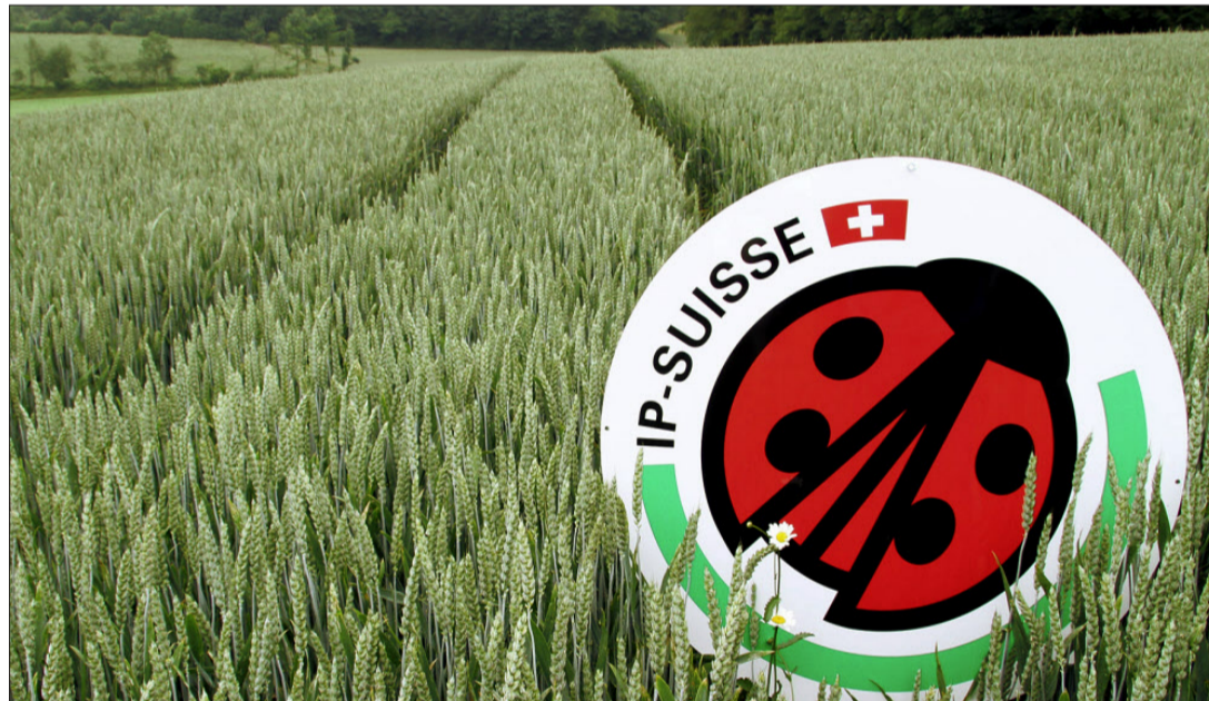
Die Nachfrage nach IP-Suisse-Weizen steigt im Jahr der Biodiversität.

IP-Suisse musste dieses Jahr viele Getreideproduzenten, zum Teil auch langjährige, enttäuschen und konnte aufgrund hoher Erntemengen 2008 und 2009 und einer tieferen Nachfrage nach IPS-Getreide nicht mehr alle Abnahmeverträge erneuern. Dies löste bei vielen Produzenten Unmut und Frust aus. IP-Suisse hat alle Hebel in Bewegung gesetzt und nun entgegen den Erwartungen von vielen Branchenkennern in den letzten Wochen erreicht, dass die Bedarfsmengen an IP-Suisse-Weizen bereits für die kommende Ernte wieder deutlich steigen. Der Migros Genossenschaftsbund (MGB) und Jowa, die Bäckerei der Migros, handelten gemäss Andreas Stalder, Präsident IP-Suisse, aus, dass in den nächsten zwei Jahren die Mengen an IP-Suisse-Weizen um rund 45 Prozent steigen. Das entspricht einer signifikant höheren Menge, als