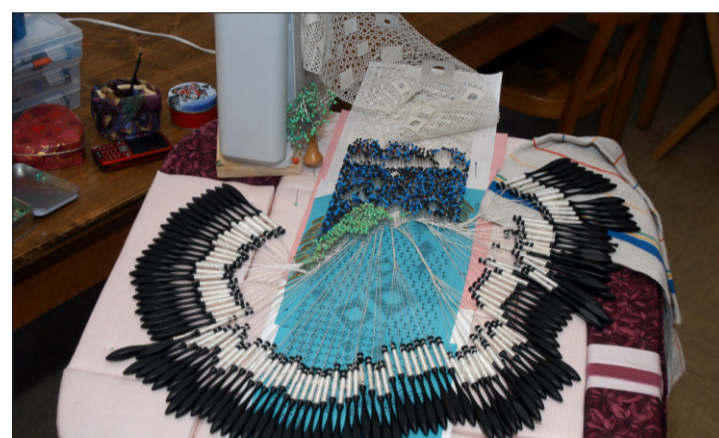
während Fortgeschrittene dann schon mal mit 76 Paaren oder 152 Klöppeln zu tun haben.