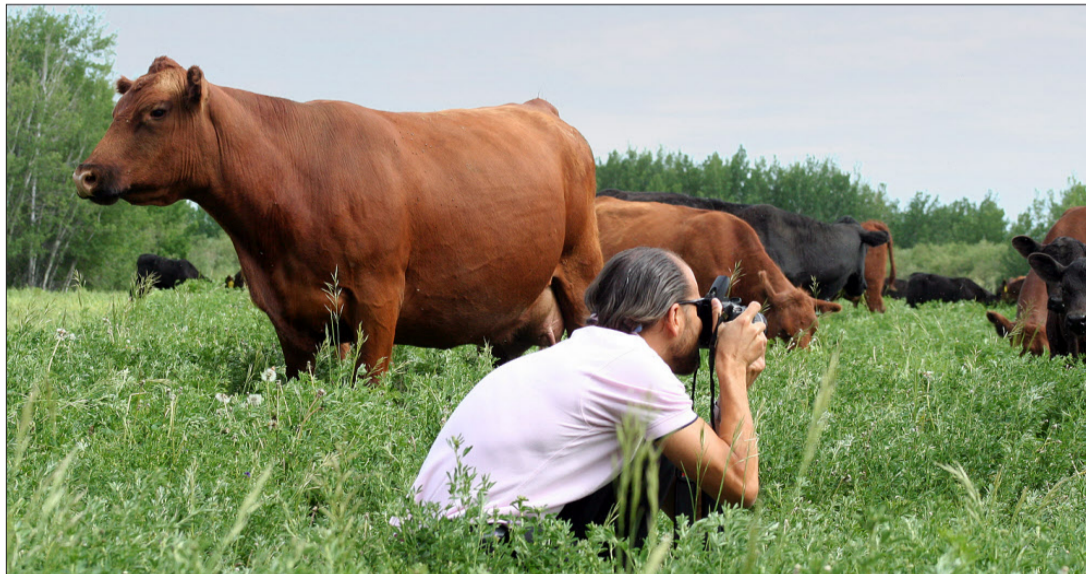
Der Fotograf für das Hotel Park Hyatt Zürich im Einsatz...

Heute ist der längste Tag des Jahres. So schnell geht das. Es ist halb elf Uhr abends, die Sonne scheint immer noch, und es dauert noch eine Stunde, bis es langsam dunkel wird. Um vier Uhr morgens ist es wieder hell, und ein weiterer Tag beginnt. Ich liebe diese Jahreszeit! Wir verbringen die meiste Zeit draussen bei den Kuhherden, im Garten oder bei irgendwelchen anderen Arbeiten. Vor allem auch die Kinder geniessen die warme Jahreszeit. Jeden Abend habe ich mit unseren zwei älteren Buben eine Diskussion, da sie davon überzeugt sind, dass man erst schlafen geht, wenn es dunkel ist! Jeden Morgen sage ich zu mir selbst: «So, heute Abend bin ich dann wieder einmal früher im Bett...» Irgendwie klappt es dann doch nie. Wie auch immer, der Sommer ist hier so kurz