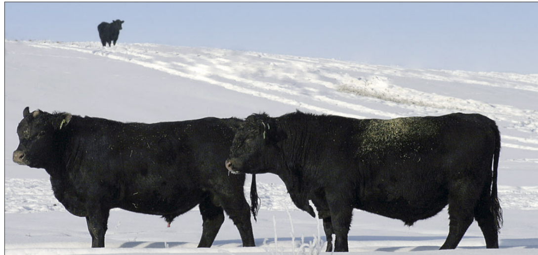
Die Zuchtstiere in Kanada spüren den Frühling trotz viel Schnee.

Heute Morgen war ich ganz erstaunt, als ich aus dem Fenster sah. Unsere Kälber vom letzten Frühling waren überall im Feld verstreut am Herumrennen. Auch die Zuchtbulln waren gruppenweise auf einer riesigen Fläche unterwegs und kämpften zusammen und rannten in alle Richtungen. Was war da bloss los? Christoph musste mit jemandem zum Flughafen in Grande Prairie fahren und hatte keine Zeit, um nach dem Rechten zu sehen. So fuhr ich mit unseren Söhnen im Schlepptau in unserem Safari-Auto mit Vierradantrieb durch den Schnee und versuchte, die Ursache für die Unruhe in den Viehherden zu finden. Alles sah gut aus. Ich dachte mir, dass ich vielleicht ein paar Kojoten sehen würde oder allenfalls auch einen Elch. Nichts. Alle Tiere waren gesund und munter, aber immer noch