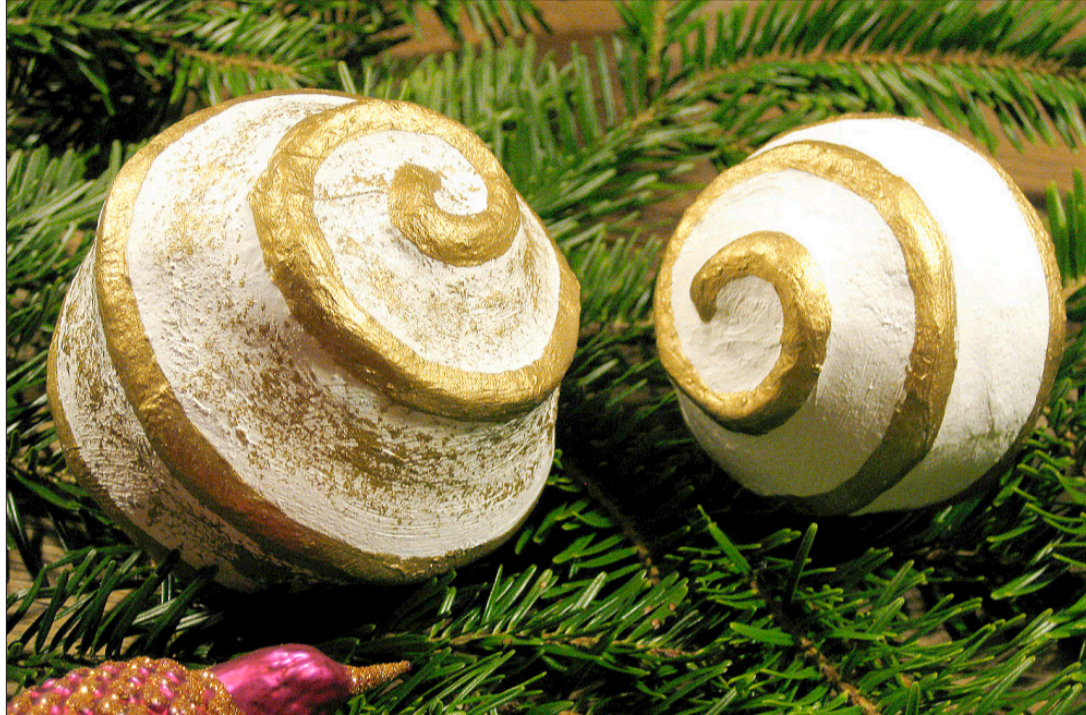
Ob hingelegt oder aufgehängt, die Kugeln sind ein Blickfang.

Plastik ab. Die Gipsbandage schneidet man in etwa 2 cm breite Streifen (insgesamt etwa 12 bis 15 Stück). Nun taucht man die Gipsstreifen kurz in das mit Wasser gefüllte Becken, nimmt sie heraus und tropft sie gut ab. Dann legt man die Streifen auf die aufgesteckte Schnur, bis die ganze Spirale zugedeckt ist. So wird die Reliefwirkung verstärkt. Vermeiden Sie allzu grosse Falten, und streichen Sie die Gipsbandage schön glatt. Jetzt wird die ganze Kugel mit