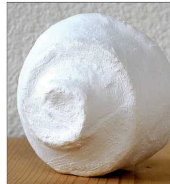
Anschliessend ganz abdecken und glatt streichen.

den. Dann gibt man Leim auf die Aufhängenadel und steckt sie in die Kugel. Falls die Kugeln auf einem Dekorationsteller arrangiert werden, ist kein Aufhänger notwendig.