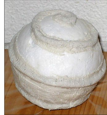
Die Schnur wird mit der Gipsbandage abgedeckt.

Um die Aufhängenadel anzubringen, muss mit einer Nähnadel ein Loch vorgestochen wer-