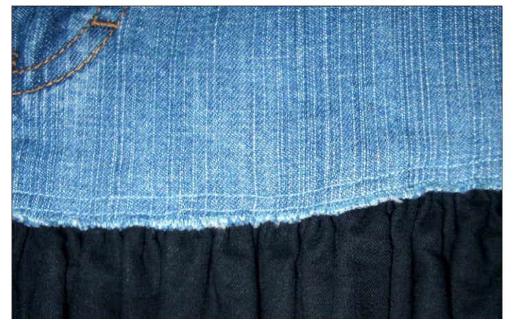
So präsentiert sich die aufgesteppte Jeanskante.

cken und bügeln. Den gebügelten Einschlag direkt der Kante (=Stoffbruch) entlang mit engem Zickzackstich versäubern. Den überstehenden Saum auf der Rückseite sorgfältig zurückschneiden.