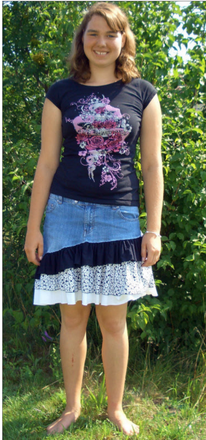
Der fertige Rüschenjupe, eine ideale Wiederverwertung für alte Jeans. (Bilder: Therese Kurth)

Dritte Rüsche: Ein Stoffstreifen von 1,50 m Länge, auf der linken Seite 20 cm und auf der rechten Seite 30 cm breit. Dazu