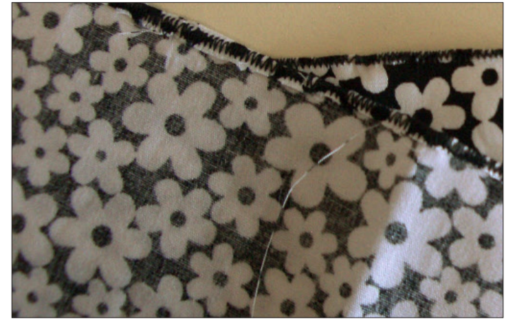
Die versäuberte Rüschenkante von vorne und von hinten.

4. An jeder Rüsche den Saum auf ca. 0,5 cm einschlagen, ste-