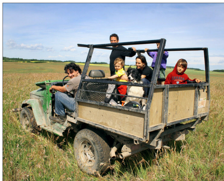
Mit Freunden aus Argentinien auf Safari... das macht Spass!

Interessanterweise können sich diese Ansichten auch verändern. Zum Beispiel hatte ich als Kind das Gefühl, richtig abgelegen zu wohnen, weil wir das